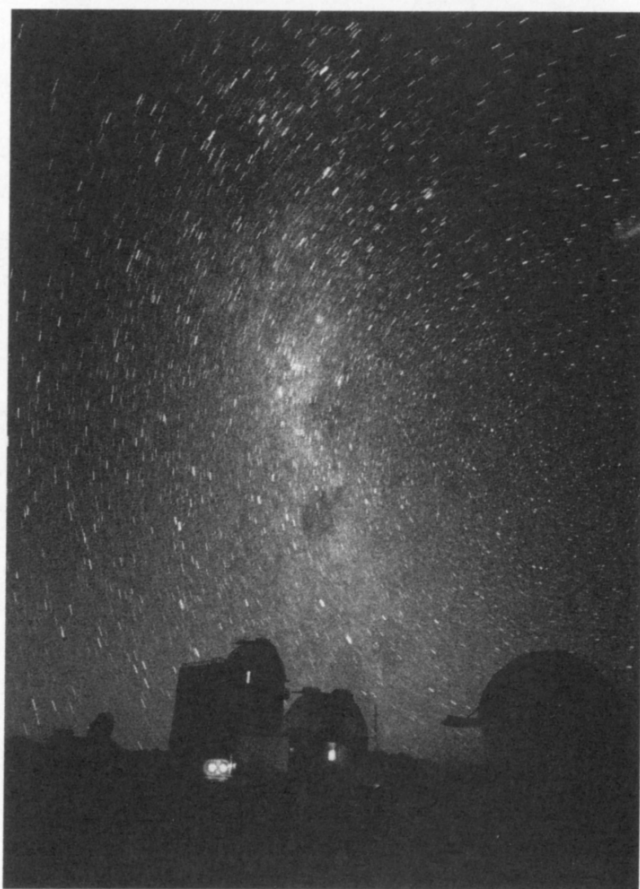
La Voie Lactée

a pu rassembler, figure aussi le 'Chemin de Rome' dont il situe l'usage en Suisse et en Italie. Mais on n'y trouve pas trace des autres saints, ni d'Abraham, ni de Brunehaut, ni de la Vierge – qui, de toutes façons, semblent être des appellations très minoritaires, voire palliatives, en Wallonie : le nom du saint original, vraisemblablement oublié, fut remplacé par celui d'un autre protecteur, probablement local.