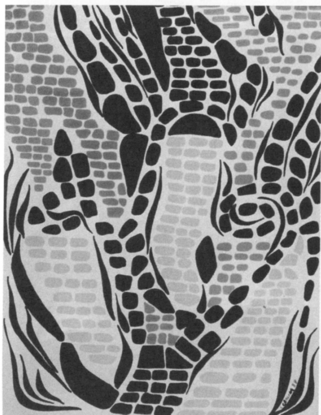
Le Pavé de Saint-Jacques par C. Gerling (reproduit avec l'aimable autorisation de l'artiste) ( http://vizier.u-strasbg.fr/~heck/vlactee.jpg )

Dans sa bible des noms célestes 2 , Allen reprend aussi la 'Route de Saint-Jacques-de-Compostelle' dont il attribue l'utilisation pour la Voie Lactée à la paysannerie française, de même que comme appellation populaire espagnole.