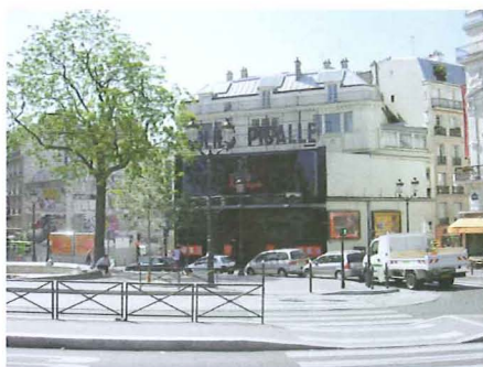
Fig. 10a et b. – Les quartiers «chauds» du Nord de la ville (ici Pigalle) ont aussi eu leur lot de médaillons, mais beaucoup semblent avoir disparu.