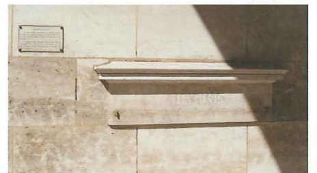
Fig. 6. – Après avoir repéré le médaillon se trouvant sur le trottoir côté Sénat de la Rue de Vaugirard, traversez celle-ci pour localiser sous les arcades ce petit mémorial au mètre étalon. Le texte de la plaque dit ceci: «La Convention nationale, afin de généraliser l'usage du système métrique, fit placer seize mètres étalons en marbre dans les lieux les plus fréquentés de Paris. Ces mètres furent installés entre février 1796 et décembre 1797. Celui-ci est l'un des deux derniers qui subsistent à Paris et le seul qui soit encore sur son site originel.»