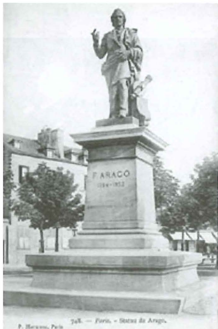
Fig. 2a. – La statue de FRANÇOIS ARAGO, d'après une ancienne carte postale, telle qu'elle existait entre 1893 et 1942 sur la Place de l'Île de Sein à Paris (voir texte).

Mais les pavés de Paris peuvent aussi receler des choses bien intéressantes pour le touriste, et pour l'astronome promeneur en particulier. Comme par exemple cette centaine de petites plaques en bronze réparties dans la ville. Distribuées au hasard? Non point. Reportées sur une carte, leurs positions dessinent une ligne droite, située à l'intérieur du Boulevard Périphérique et allant de la Porte de Montmartre à la Cité Universitaire. Regardons mieux. Cette droite, ô surprise, est orientée Nord-Sud et passe par l'Observatoire de Paris. Il s'agit donc d'une matérialisation du méridien de Paris.