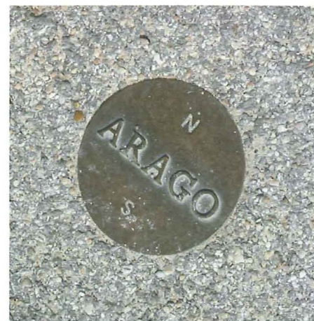
Fig. 3. – Gros plan sur l'un des médaillons de bronze, ici dans un des chemins du Parc Montsouris. Les symboles Nord et Sud donnent les directions dans lesquelles trouver les autres médaillons. (© AL NATH)

Fig. 2c. – La face Sud du socle avec, en son centre, un des médaillons Arago de l'œuvre de JAN DIBBETS (voir texte). On distingue sur la gauche, par delà la cime des arbres du Boulevard Arago, le sommet de la coupole située sur le toit de l'Institut d'Astrophysique de Paris. Le graffiti au bas du socle rappelle la proximité de la Maison d'Arrêt de la Santé. (© AL NATH)