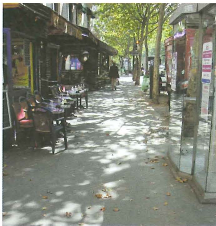
Fig. 7. – Les premières feuilles mortes rendent la tâche un peu plus difficile à Saint Germain des Prés (ici Boulevard Saint Germain).