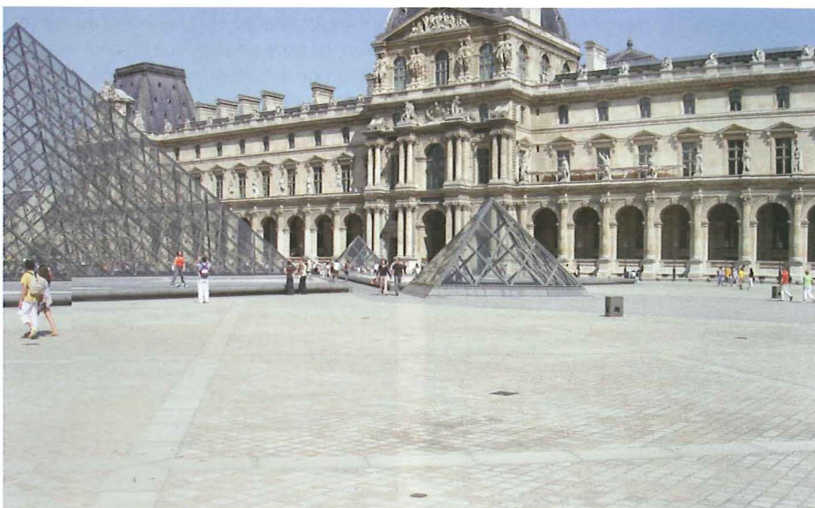
Fig. 9a et b. – Plusieurs médaillons ont été posés dans la Cour Napoléon du Louvre, non loin des pyramides de Ieoh Ming Pei.