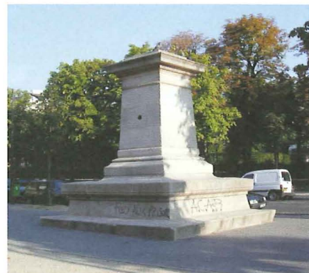
Fig. 2c. – La face Sud du socle avec, en son centre, un des médaillons Arago de l'œuvre de JAN DIBBETS (voir texte). On distingue sur la gauche, par delà la cime des arbres du Boulevard Arago, le sommet de la coupole située sur le toit de l'Institut d'Astrophysique de Paris. Le graffiti au bas du socle rappelle la proximité de la Maison d'Arrêt de la Santé.