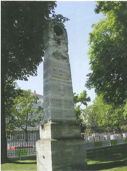
Fig. 4a. – Le Parc Montsouris est un bon endroit pour s'exercer à la recherche des médaillons, mais gare aux fausses pistes! Cette mire par exemple se trouvait autrefois sur le passage exact du méridien de Paris, mais ce n'est plus le cas aujourd'hui, ayant été déplacée de sa position originale.