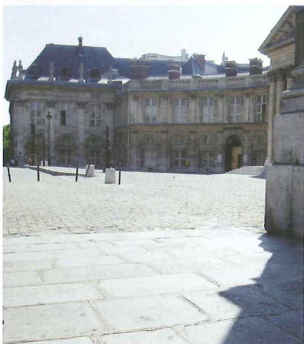
Fig. 8. – Où les médaillons flirtent avec les lieux de prestige: ici au Quai de Conti, juste à côté de la Place de l'Institut (académies). (© AL NATH)