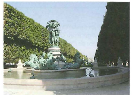
Fig. 5. – L'une des plus belles perspectives de Paris, celle de l'Avenue de l'Observatoire (celui-ci est dans le dos du photographe) avec au fond le Palais du Luxembourg (Sénat) et ses jardins. La recherche des médaillons y rappellera à certains la chasse aux œufs de Pâques ...

FRANÇOIS ARAGO (Estagel 1786 - Paris 1853) eut une vie bien remplie, non seulement comme savant (mathématicien, physicien, astronome), mais aussi comme homme politique. Il serait audacieux de vouloir résumer toute sa carrière en quelques mots ici. Disons seulement qu'il participa à la mesure aventureuse d'un arc de méridien en Espagne (1806), qu'il fut membre de l'Académie des Sciences (1809), professeur à l'École Polytechnique, Directeur de l'Observatoire de Paris puis du Bureau des Longitudes, député (1830-1948), Ministre de la Guerre et de la Marine, etc. Ses travaux scientifiques concernèrent la chromosphère solaire, la polarisation chromatique, la vitesse du son, la réfraction des gaz, l'électromagnétisme, etc.