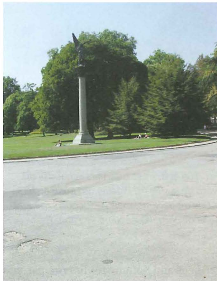
Fig. 4b. – Un autre médaillon en premier plan près de l'entrée Nord-ouest du parc, mais d'autres se trouvent non loin ...

local (meridies = milieu du jour). Le plus célèbre des méridiens est celui de Greenwich, près de Londres, car considéré comme référence horaire par des accords internationaux 2 . Auparavant